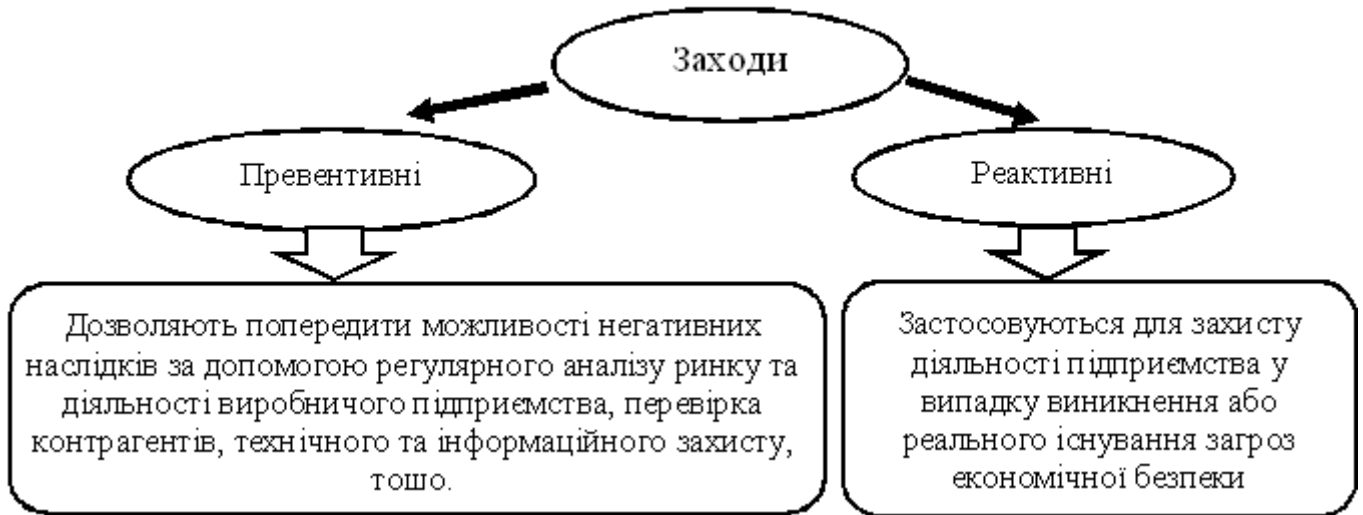
Рис. 1. Заходи превентивного і реактивного характеру

Стратегія - це довгостроковий план щодо досягнення певної мети. На основі стратегії забезпечення економічної безпеки сучасного виробничого підприємства реалізується поточне планування, що, неодмінно, означає використання певних процедур і виконання чітких дій для досягнення даних цілей. В цілому рівень економічної безпеки сучасних виробничих підприємств визначається станом усіх її функціональних складових. У процесі побудови моделі оцінки рівня економічної безпеки на основі всебічного аналізу основних показників динаміці фінансово-господарської діяльності обраного підприємства за сферами: «фінанси - виробництво - основні засоби - кадри», були виділені 5 рівнів безпеки [7, с. 173]. Кожному рівню економічної безпеки сучасного виробничого підприємства відповідає певна стратегія розвитку. Так, в умовах критичної безпеки, розлади економічної діяльності виробничого підприємства повинна застосовуватися необхідна стратегія виживання. Вона передбачає реалізацію швидких, точних, скоординованих дій, своєчасних рішень щодо виведення виробничого підприємства з кризи. Стратегія регулювання застосовується